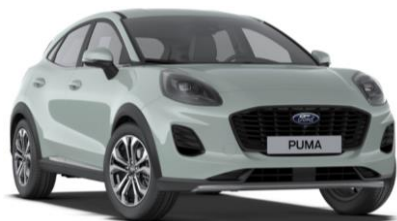
Cactus Gray nemetalická

● štandardná výbava ■ nie je k dispozícii □ dostupné v pakete