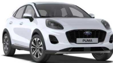
Frozen White nemetalická