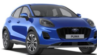
Desert Island Blue metalická