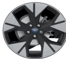
18" disky z ľahkej zliatiny Štandardná výbava pre ST-Line X