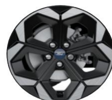
19" disky z ľahkej zliatiny Voliteľná výbava ST-Line a ST-Line X D2VCA