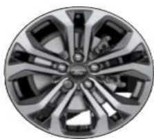
17" disky z ľahkej zliatiny, čierne s povrchovou úpravou Štandardná výbava Titanium