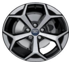
17" disky z ľahkej zliatiny ST-Line, s povrchovou úpravou Štandardná výbava pre ST-Line