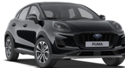
Agate Black metalická