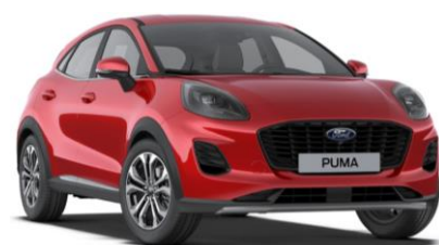
Fantastic Red metalická