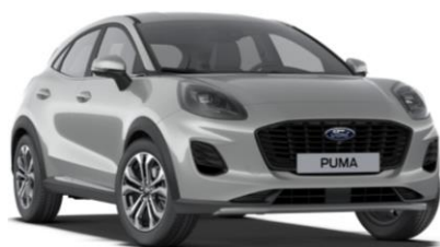
Solar Silver metalická