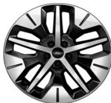
19" zliatinové disky čierna Absolute sériová výbava pre Select Voliteľné pre Style a Premium (D2GDA)