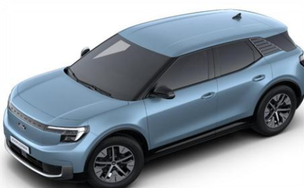
Arctic Blue metalická