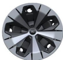
19" oceľové disky s celoplošnými aero. krytmi sériová výbava pre Style