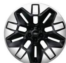
21" zliatinové disky čierna Absolute Voliteľné pre Premium D2GCX