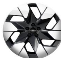
20" zliatinové disky šedá Magnetic sériová výbava pre Premium