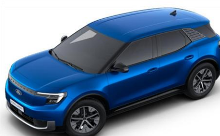
Blue My Mind prémiová metalická