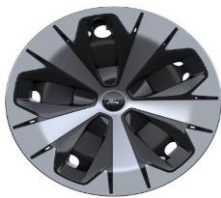
19" ocelevé disky s celoplošnými aerodynamickými