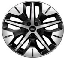
19" zliatinové disky čierna Absolute Línia výbavy Explorer