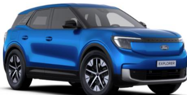
Blue My Mind prémiová metalická