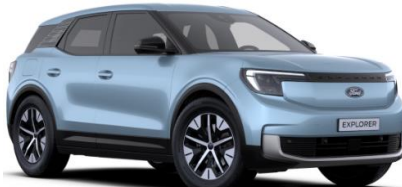
Arctic Blue metalická