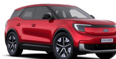
Lucid Red prémiová metalická