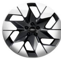
20" zliatinové disky šedá Magnetic Línia výbavy Premium