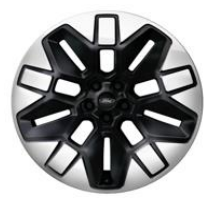
21" zliatinové disky čierna Asphalt Matt Voliteľne