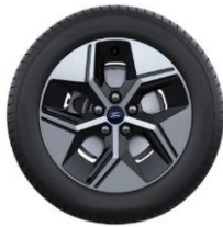
17" disky z ľahkej zliatiny Sériová výbava pre Gen-E