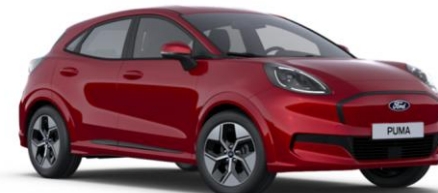
Fantastic Red metalická