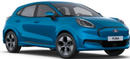
Digital Aqua Blue metalická