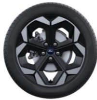
18" disky z ľahkej zliatiny Sériová výbava pre Premium