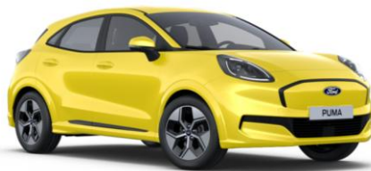
Electric Yellow metalická

● štandardná výbava — nie je k dispozícii □ dostupné v pakete