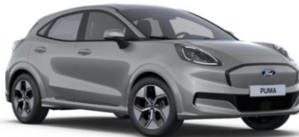
Solar Silver metalická