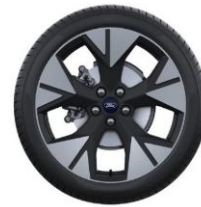
19" disky z ľahkej zliatiny Voliteľná výbava D2VCA