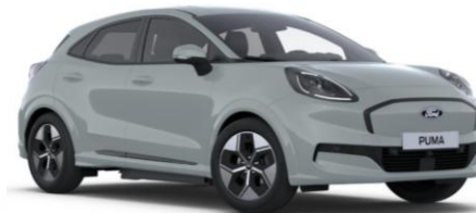
Cactus Gray nemetalická